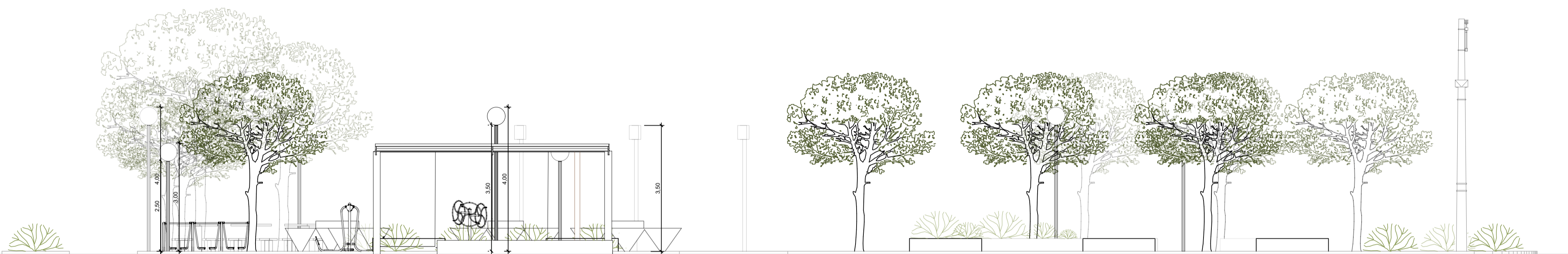
FACHADA PARA AVENIDA PRESIDENTE KENNEDDY ESCALA 1:75