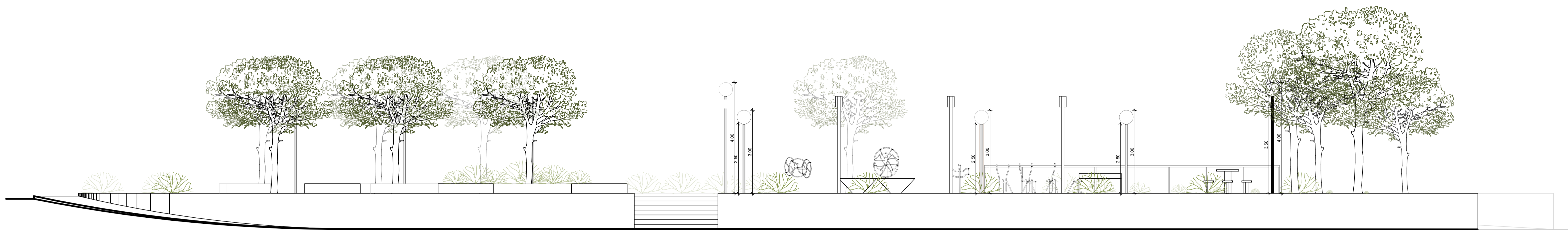
FACHADA PARA RUA JOSÉ FAGUNDES PINTO ESCALA 1:75